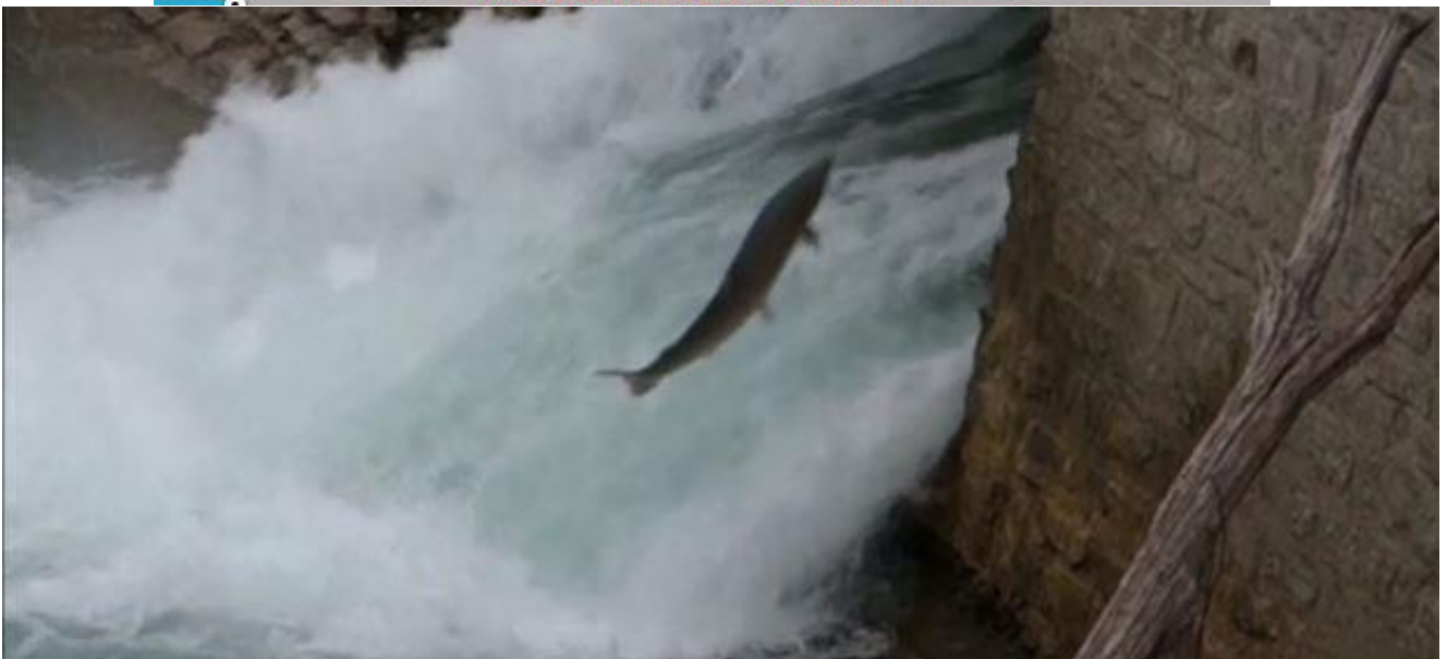
Digue Oloron une photo du 31 juillet 2018 d'un Poisson se blessant contre les parois.