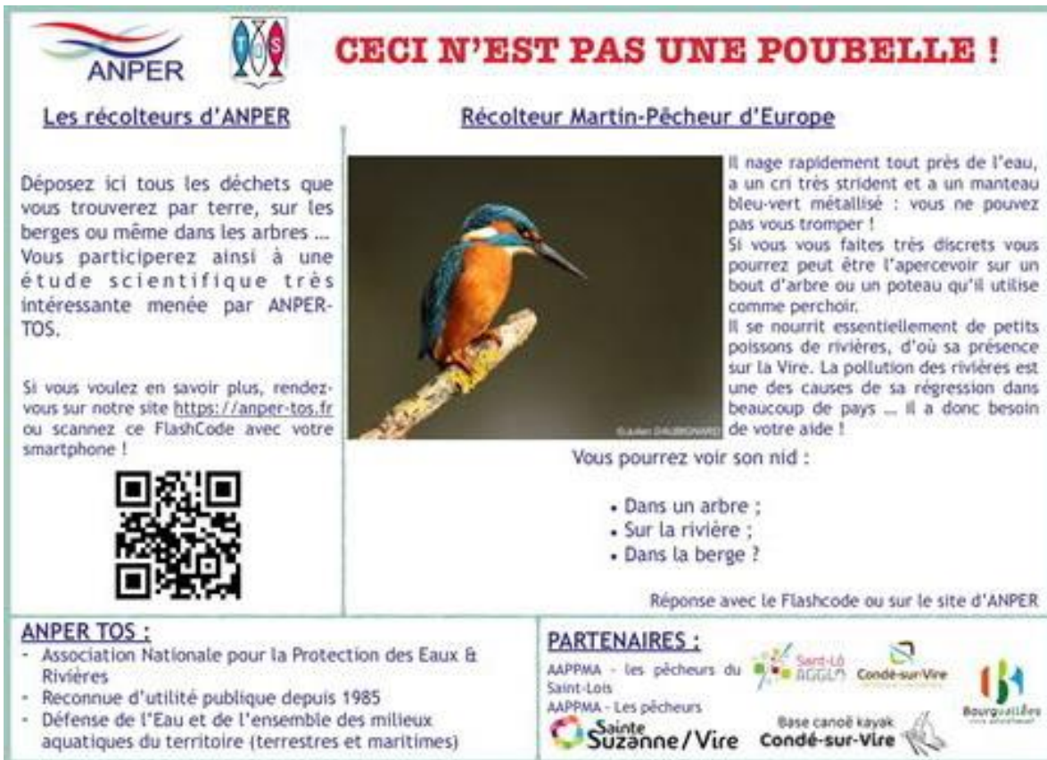
Exemple d'affiche se trouvant sur les récolteurs